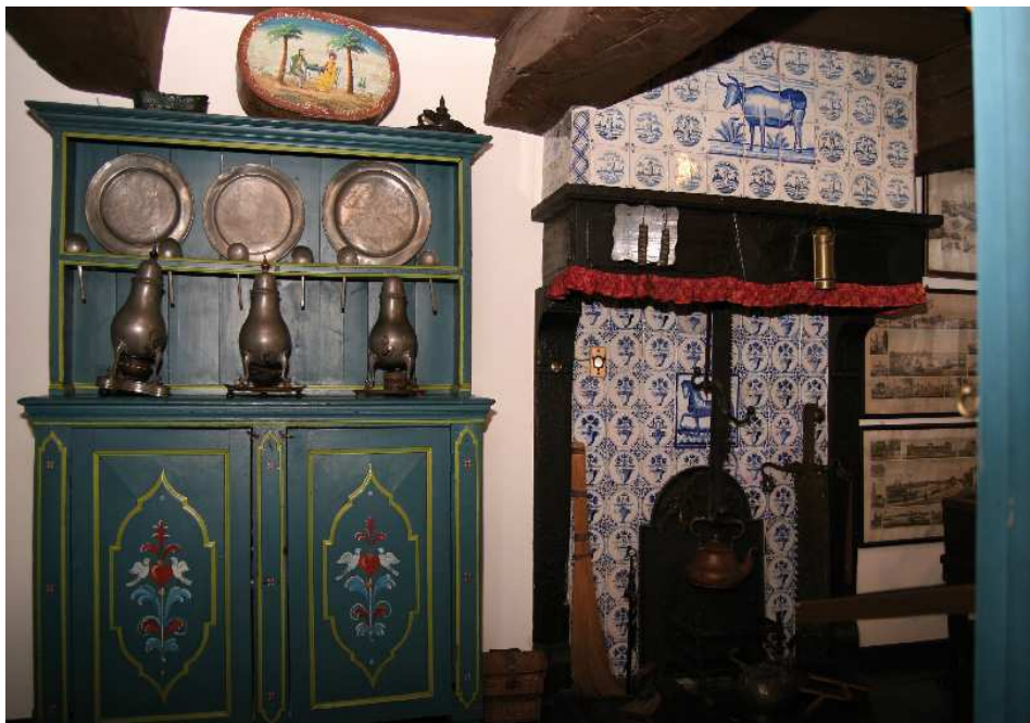
Museum Haus „Samson“