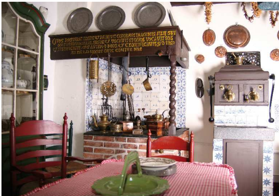
Museum Haus „Samson“