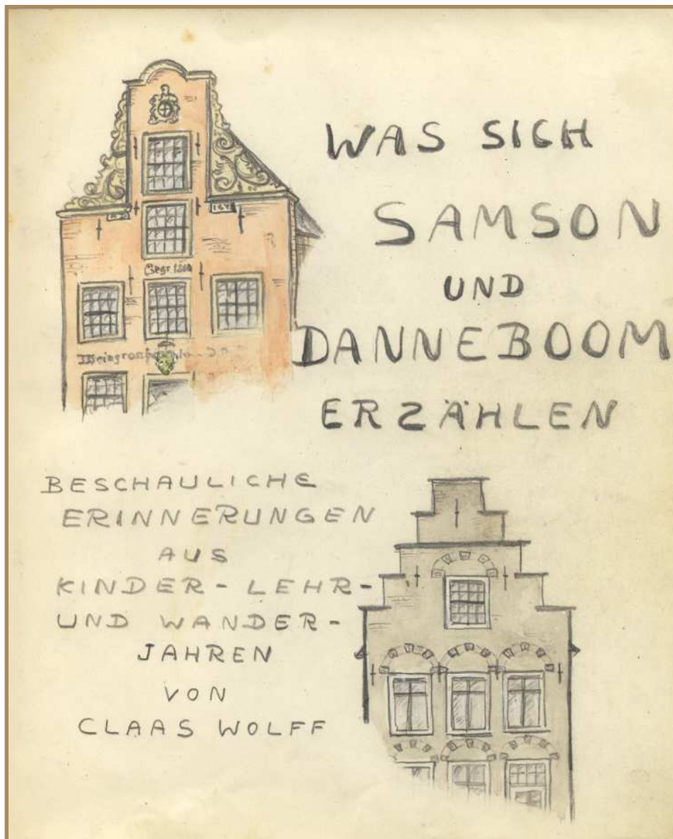
Auszüge aus dem Buch „Was sich Samson und Danneboom erzählen“ von Claas Wolff