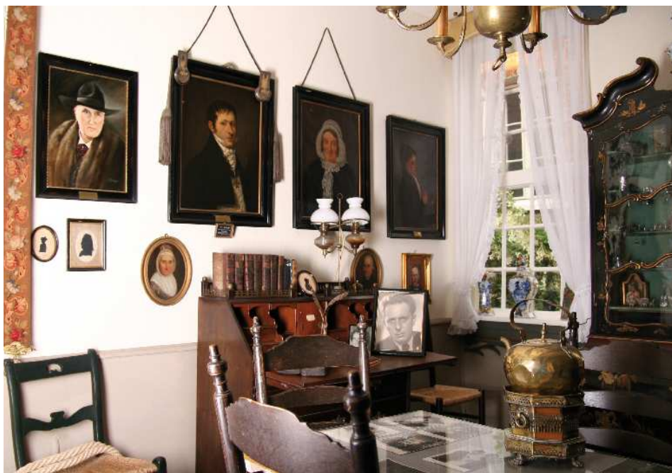
Museum Haus „Samson“