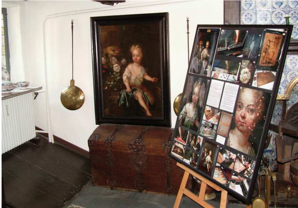
Restauriertes Bild im Museum „Samson“ 2008