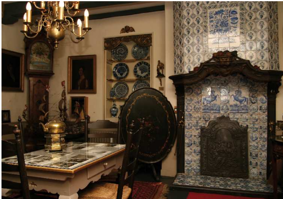
Museum Haus „Samson“