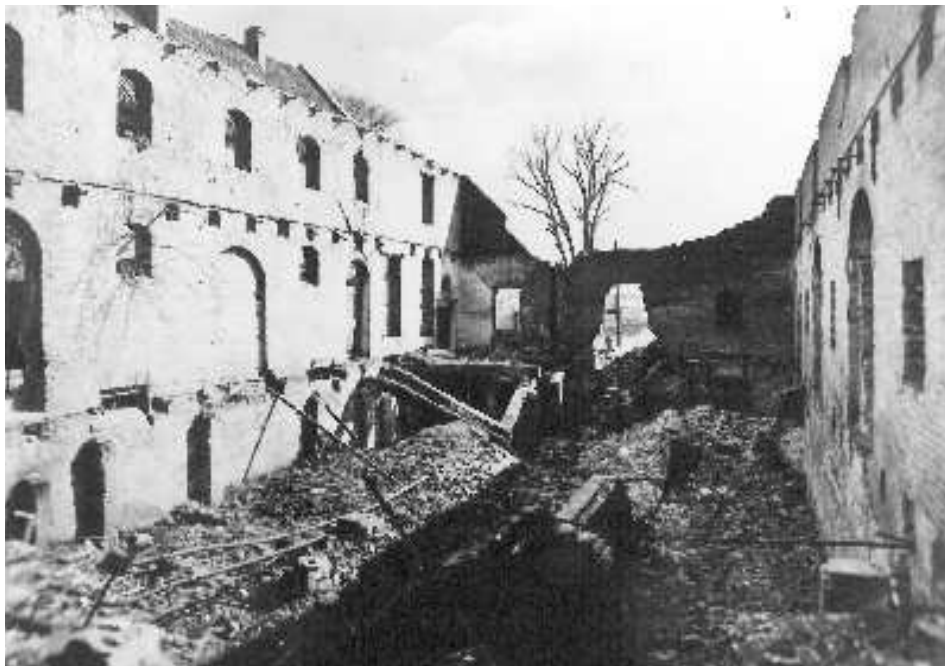
Zerstörter Weinkeller und zerstörtes Lager „LEDA“ an der Hellingstraße nach dem 2. Weltkrieg

Das Firmengeschäft lag durch den Brand des Hauses „Am Helling 5“ völlig darnieder. Die Vorräte an Wein und Spirituosen waren geplündert bzw. beschlagnahmt. Wie wenig geblieben war, macht die Aufstellung des Lagerbestandes vom 31.12.1946 an anderer Stelle deutlich.